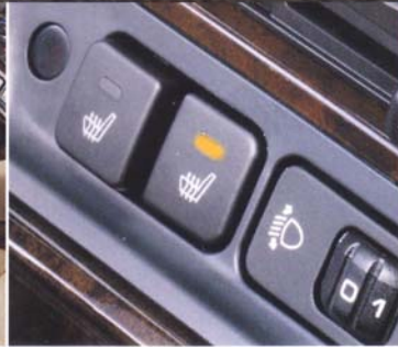
Sitzheizung für die Ledersitze