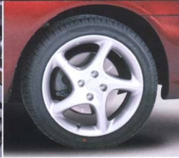
Exklusive 16" Leichtmetallräder mit 205/45 Bereifung