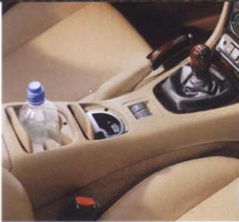
Praktische Ablagen wie Getränkehalter in der Mittelkonsole